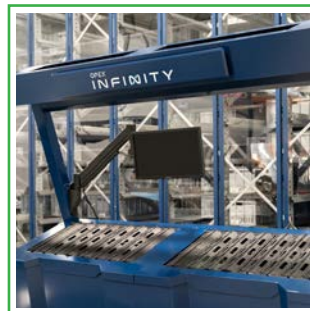
デカップリングプレゼントポート