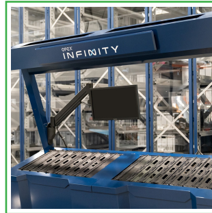
デカップリングプレゼントポート